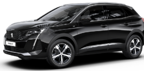
ペルラ・ネラ・ブラック