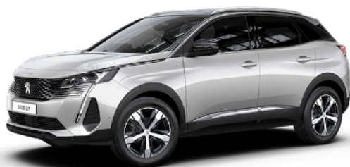
パール・ホワイト

カラーはレッドナッパレザーとのコーディネートした2色を設定いたしました。より華やかさが際立つパール・ホワイトと、内外装のコントラストによる精悍さが魅力のペルラ・ネラ・ブラックからお選びいただけます。